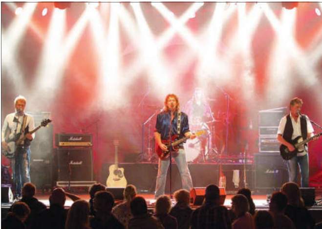
Die „Smokie Revival Band“ unternimmt gemeinsam mit dem Publikum eine Zeitreise und wecken dabei die unterschiedlichsten (Jugend-)Erinnerungen.